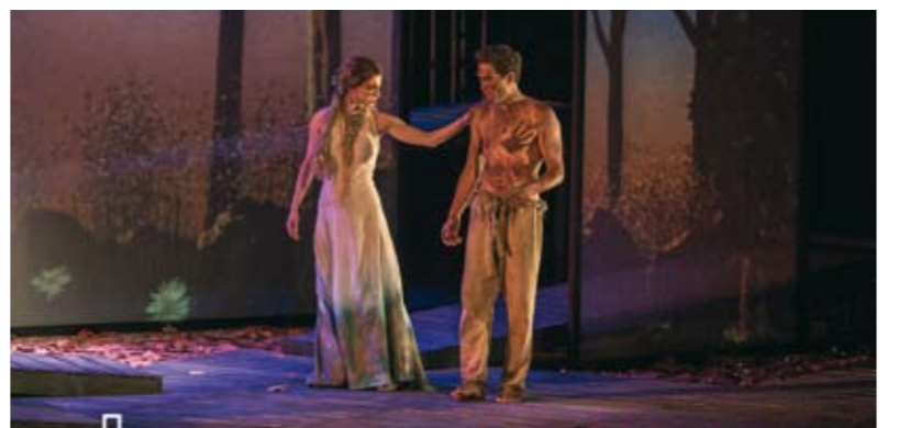
Eco y Narciso

GAL Eco y Narciso é a historia dun amor inalcanzable. Mitos que se confunden no reflexo do seu namorado, que esgotan o intento de recoñecerse na persoa amada