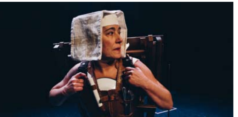
A noiva de Don Quixote

Dulcinea dispónse a atravesar o seu particular dó, no que se rebela contra a personaxe que Cervantes lle atribuíu na novela. Con humor, con ironía, con emoción e descrenza, desvélanos algúns insospitados acontecementos que non aparecen no Quixote, en especial a misteriosa historia de amor entre unha pastora que lles fala baixinho ás ovelas e un fidalgo que le novelas de cabalerías.