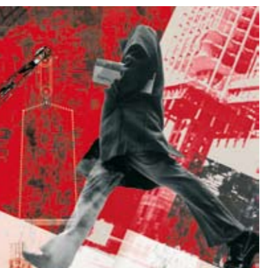
O servidor de dous amos

GAL Talía teatro presenta unha revisión do clásico Il servitori di due padroni , un dos textos inmortalis da historia do teatro. Convertido no referente por excelencia da Commedia dell'Arte , atoparedes aquí unha reinvenção da obra de Goldoni que respecta o ritmo, a comedia e o humor da peza orixinal, pero que busca tamén incorporar novas formas de teatralidade. No noso atrevemento non facemos outra cousa que intentar respectar o verdadeiro espírito da Commedia dell'Arte , do teatro renacentista italiano: a procura da innovación polo uso de todas as novidades escénicas posibles, a persecución do "espectáculo total", unha obra que sexa capaz de deixar abraído a todo o público presente.