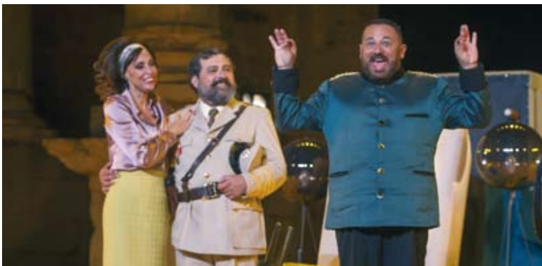
La comedia de las mentiras