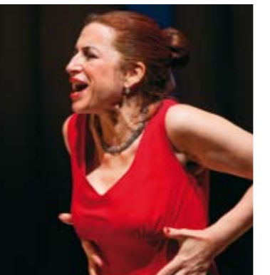
Helena: xuízo a unha lurpia