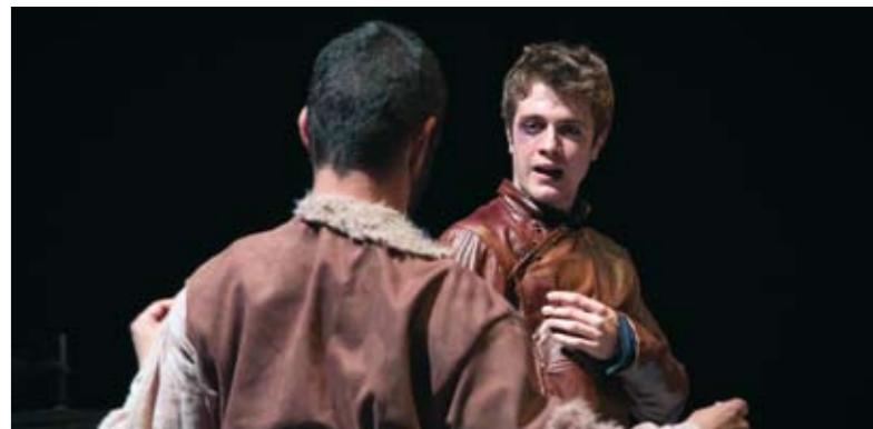
El rufián dichoso

Una vez en México, Cristóbal de la Cruz conoce a Ana de Treviño, una mujer que rechaza confesarse en su lecho de muerte ya que fue tentada por diversos demonios. Fray Cristóbal de la Cruz ayuda a que Ana de Treviño se convierta y se salve, consiguiendo así él mismo la santidad y ascender a los cielos aplaudido por los cristianos.