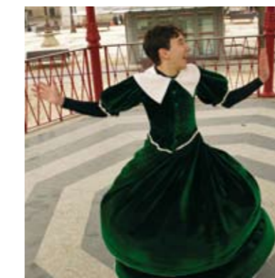
Quen ocupa esa cadeira?

En esta comedia mitológica, Calderón reescribió el mito de Ovidio de una manera delicada. Tan sencilla y hermosa y, a su vez, capaz de encerrar una reflexión que trasciende en el tiempo sobre lo que somos y lo que reflejamos ser. Una obra festiva, alegre, una caja de música llena de brillo que muestra como la apariencia oculta la verdadera esencia.