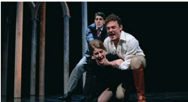
La judía de Toledo